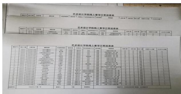
图 4 艺术设计学院线上巡查纸质版留档资料

5. 在日常教学巡查方面，本学期由于受疫情的影响，各院（部）老师都采用的是网上授课，由于没办法进入课堂对老师的上课情况进行巡查，各院（部）督导组教学巡查采取进入班级群的形式进行，或是采用每日收集班级信息员反馈信息对教师上课情况进行监控，查看教师是否提前到班，有无迟到、早退、随意调停课及学生听课情况等。整体巡查情况显示教师们都能够认真教学，学生上课积极性较高，部分教师采用录屏的方式边教学边授课。临近期末的巡查中，发现部分学生上课的积极性不太高。截止到目前，各院（部）督导组已将线上教学巡查表进行打印、归档。