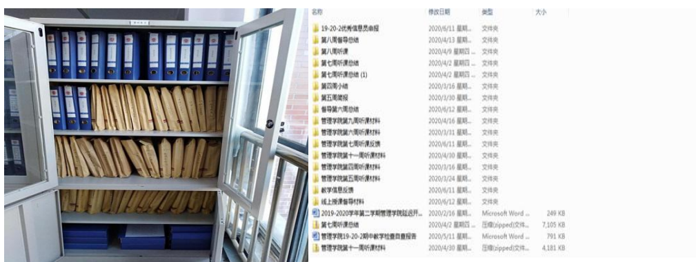
图1 建筑工程学院督导档案柜

1. 在督导组档案建设方面，各院（部）都专门建立有督导档案柜，保存资料主要为近几年的督导组材料。由于本学期前期工作以网上办公，电子资料为主，所以，本学期资料主要是后期整理的电子档存档和部分纸质版存档，资料翔实，存放有序。为了更好的保存资料，建